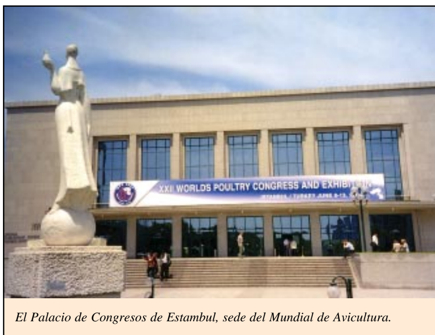
El Palacio de Congresos de Estambul, sede del Mundial de Avicultura.