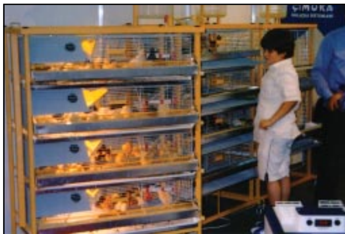
Un stand con pollitos vivos, como atracción adicional en la Exposición de avicultura.

gresos Mundiales de Avicultura se celebrarán en Brisbane, Australia, el año 2008, y Salvador de Bahía, Brasil, el año 2012, habiendo presentado los representantes de estos dos países unos atractivos videos para mostrarnos los encantos de las respectivas sedes.